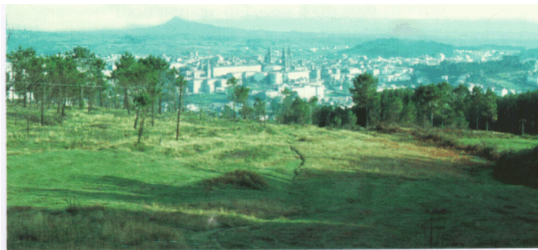
"Su herencia es hoy...un cielo figurado, la ciudad portentosa que fascina".

¡Su herencia es hoy .. un cielo figurado, la ciudad portentosa que fascina, cuya memoria tiene al alma esclava!