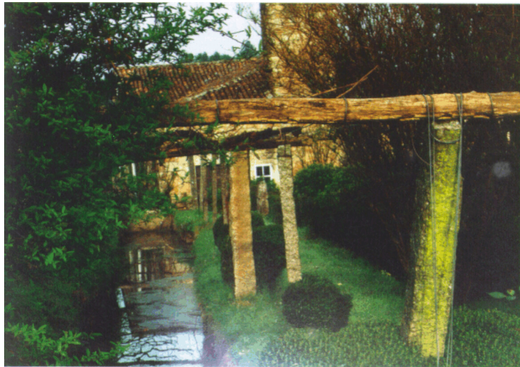
"Cabe el ribazo rústico de travieso arroyuelo"

La Tierra, humilde, atisba y se extasía: Sabe que sobre sí todo es portento... Y el hombre, pobre enfermo de infinito, se angustia entre su duda y su deseo.