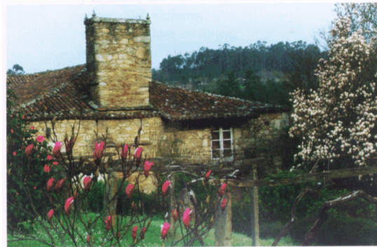
"Una casa en Galicia, sahumada por las flores"

Mis ojos van de la montaña al río; después al mar: ¡Tras la más pura estela