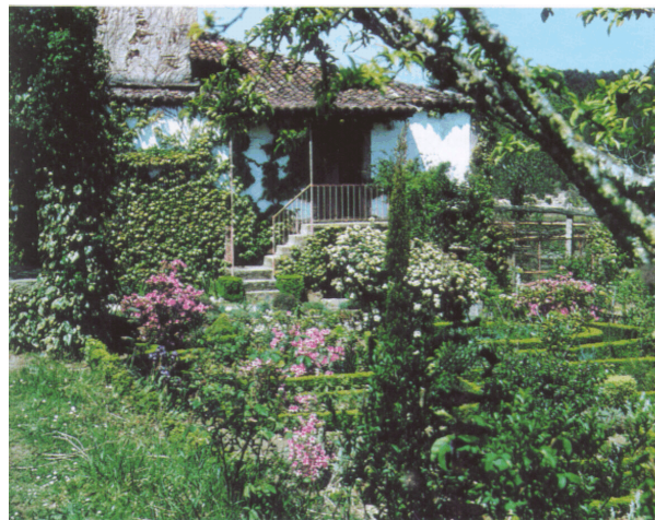
"Mi alma entumida sueña, como oasis distante una casita, apenas visible en la espesura".

Hogar ya lastimado por ausencias penosas y cada vez más nuestro, más tierno y apretado, que empaña nuestros ojos, si ya no ven sus cosas, y oprime nuestros labios de un silencio abrumado.