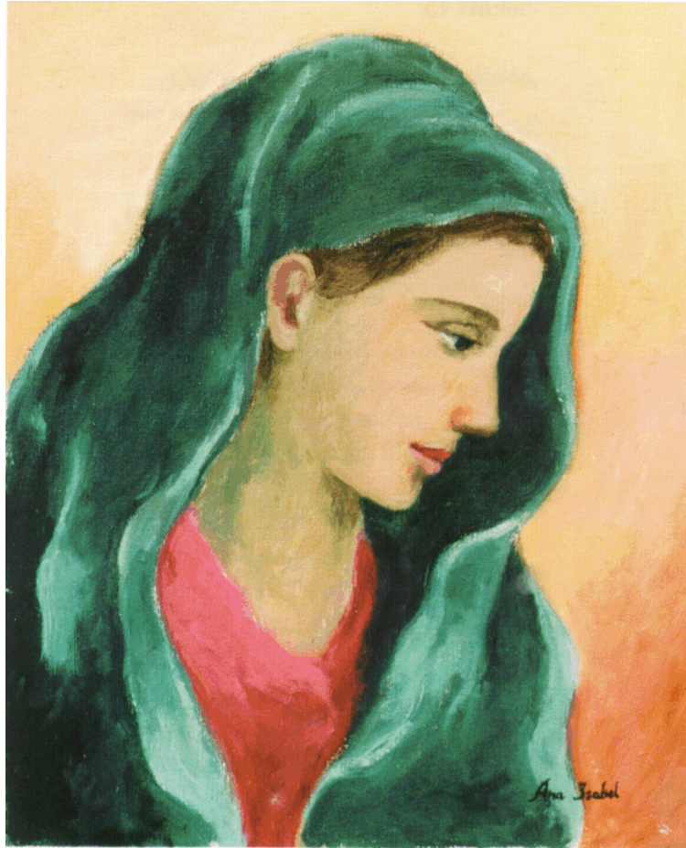
"Deja en Su rostro sus besos, María, con dulces huellas..."