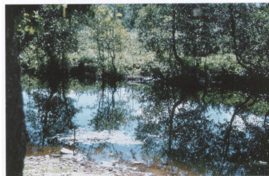
"Mis ojos van de la montaña al río. Después al mar."