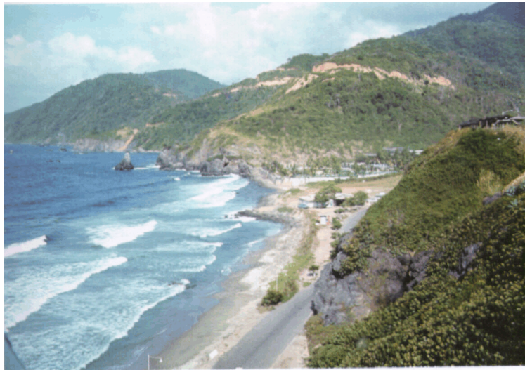
"El coche iba recorriendo el paisaje de Galicia ante nuestros ojos"...