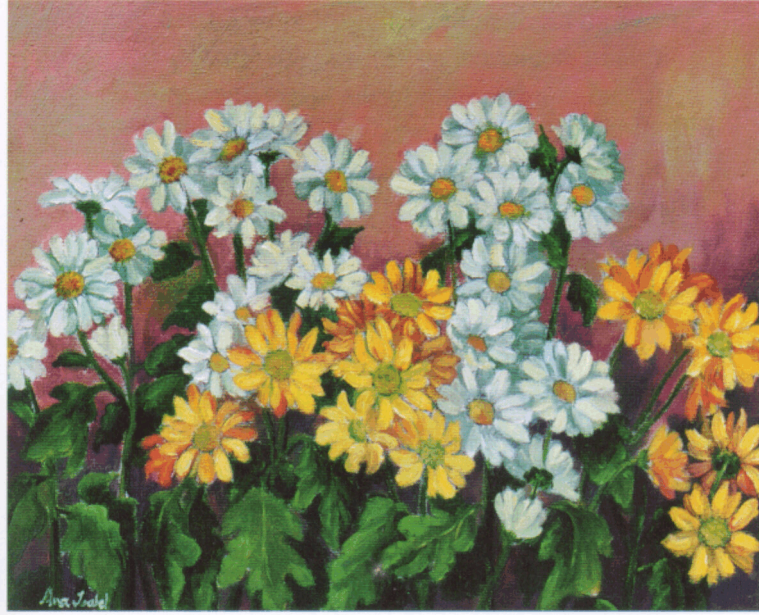
"Asoma el alba de puntillas, indecisa, y se abre, en torno, como el cáliz de una flor..."