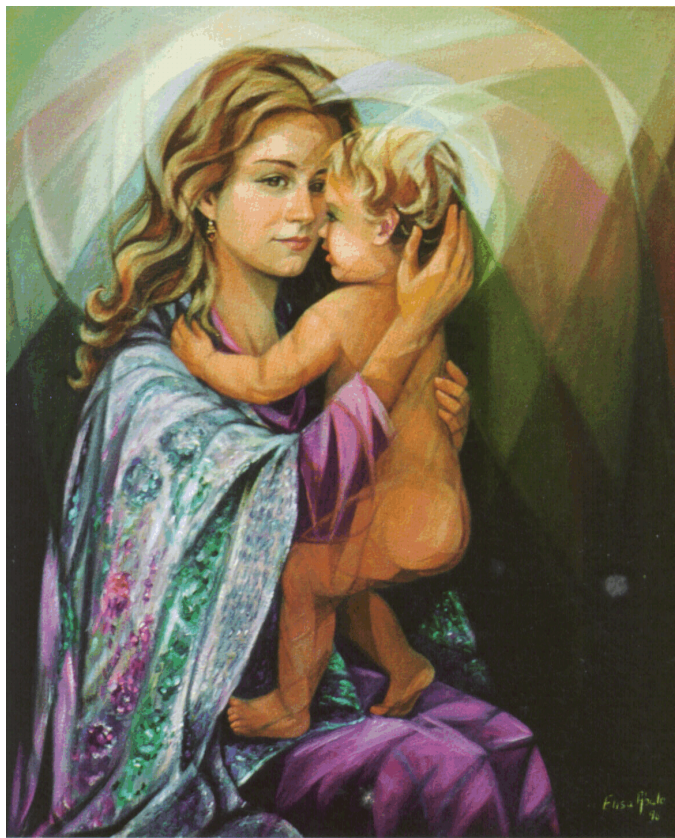
“¡Qué sensación de ventura, cuando, entre caricia y mimo, ella lo tuvo al arrimo de su faz, rosada y pura”.

Deja en Su rostro tus besos, María, con dulces huellas... Si borran nuestros excesos, acaso demos con ellas.