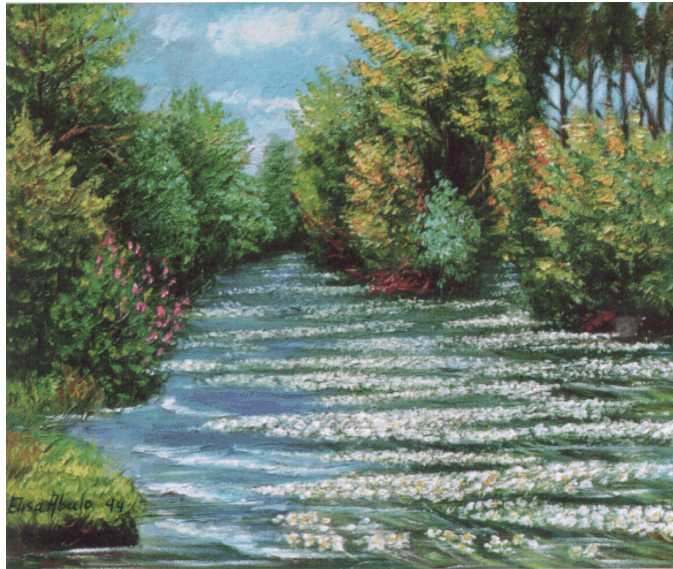
"Poeta es...tener el alma llena y abrirla sin doblez, como un paisaje".

 Hoy siento como el paso de Tu aroma: Todo lo anega un j bilo de alba!