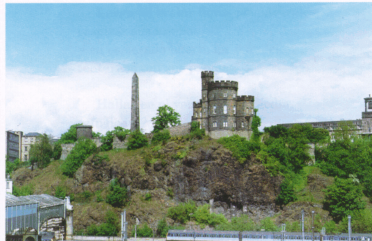
"Bosque y prado resuena tu alabanza, monte y llano, tu alterna geografía".

Neper, Maxwell, los Watt marcan tus vuelos. Bell, Fleming y así Baird, siempre presente, difunden en el mundo sus consuelos.